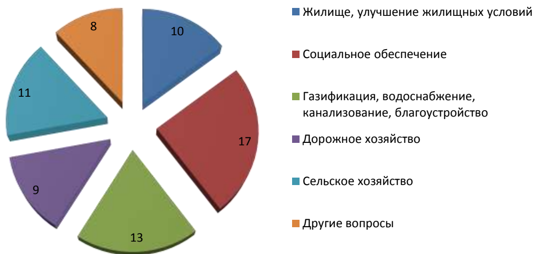
Сводные данные по обращениям граждан, поступившим в управу муниципального района "Барятинский район", в разрезе тематики обращений